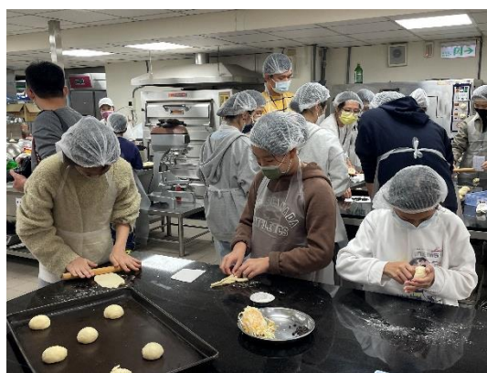
照片說明 4：營隊活動照片。