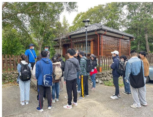
照片說明 2：南埔國小日式宿舍，相關歷史講解。