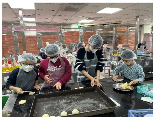
照片說明 6：營隊活動照片。