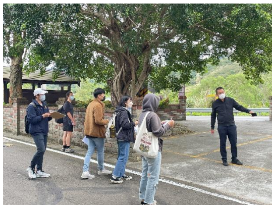
照片說明 1：南埔國小周遭進行環境講解。