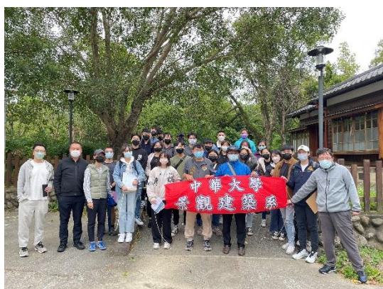
照片說明 3：南埔國小日式宿舍，團體大合照。