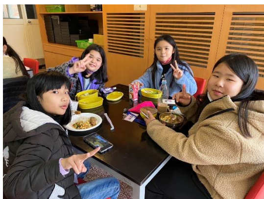
照片說明 5：營隊活動照片。